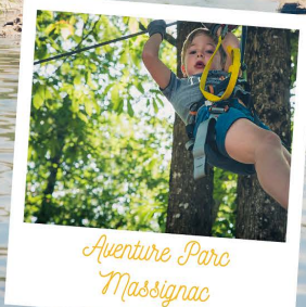
Aventure Parc Massignac