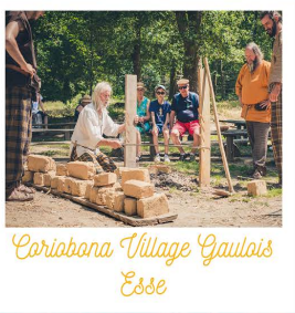
Coriabona Village Gaulois Esse